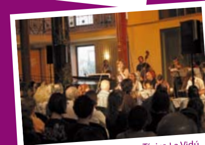
Orquesta Típica La Vidú