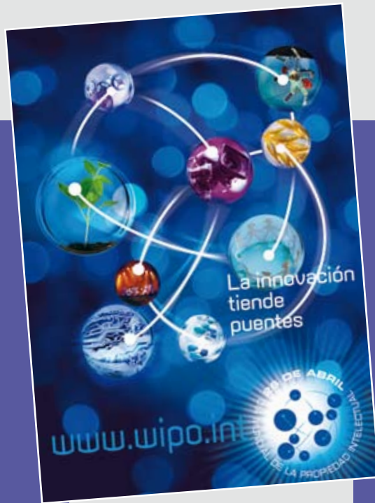
Cada 26 de abril la OMPI celebra con una comunicación especial. Aquí, el afiche de 2010.

Es decir que, por clara reivindicación de equidad, las artes en su creación y en su ejecución, no sólo validan la propiedad cultural del hombre, sino de los individuos y sus emprendimientos, como patrimonio de creación y trabajo. Esto es lo que se defiende, y como puede verse claro, en los procesos complejos de uso y de difusión, los individuos quedan indefensos para hacerse de dicho patrimonio. De allí, las necesarias Sociedades de Gestión, que en su representación, acuerdan, recaudan, administran y distribuyen, lo que mercedamente corresponde a cada cual. En todo el mundo y en cada país. Argentina tiene la fortuna de lúcidos antepasados, que concretaron en los albores del siglo XX, su Ley de Propiedad Intelectual, integralmente concebida. Dio lugar a las Entidades, que como AADI, llevan a cabo esta misión desde 1954.