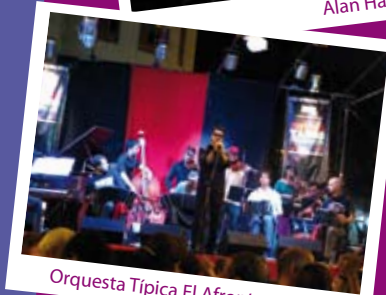
Orquesta Típica El Afronte