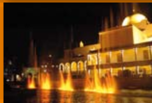
Paseo del Buen Pastor H. Yrigoyen 325