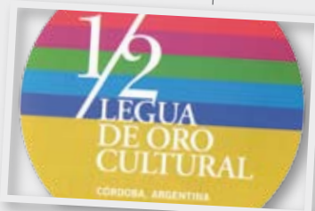
1/2 Legua de oro cultural