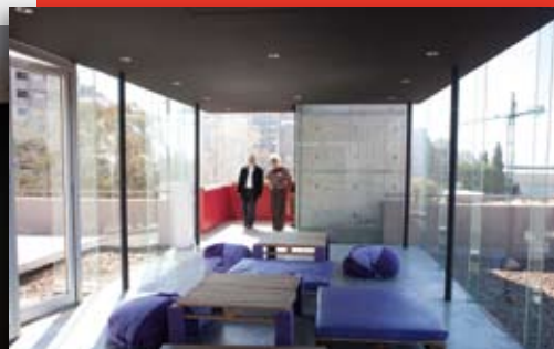
Área de recreación, donde funcionan talleres infantiles.