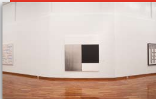
Parte de la muestra "4 museos 40 obras".

bailarina hace una performance , una danza con hilos... Va haciendo toda la composición danzando. Tiene un aspecto visual, sonoro y musical.