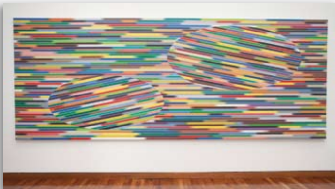
Pintura de Fabián Burgos.