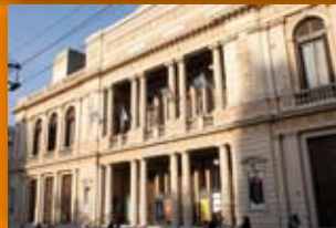
Teatro Libertador San Martín Vélez Sarsfield 365