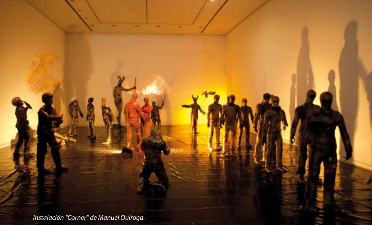
Instalación "Corner" de Manuel Quiroga.