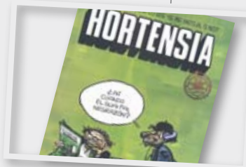
Humoradas de la revista Hortensia