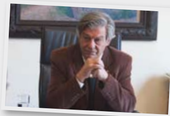
Entrevista al Secretario de Cultura