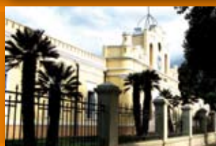
Ciudad de las Artes Av. Richieri y Concepción Arenal