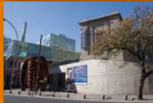
Museo Caraffa Av. Hipólito Yrigoyen 651