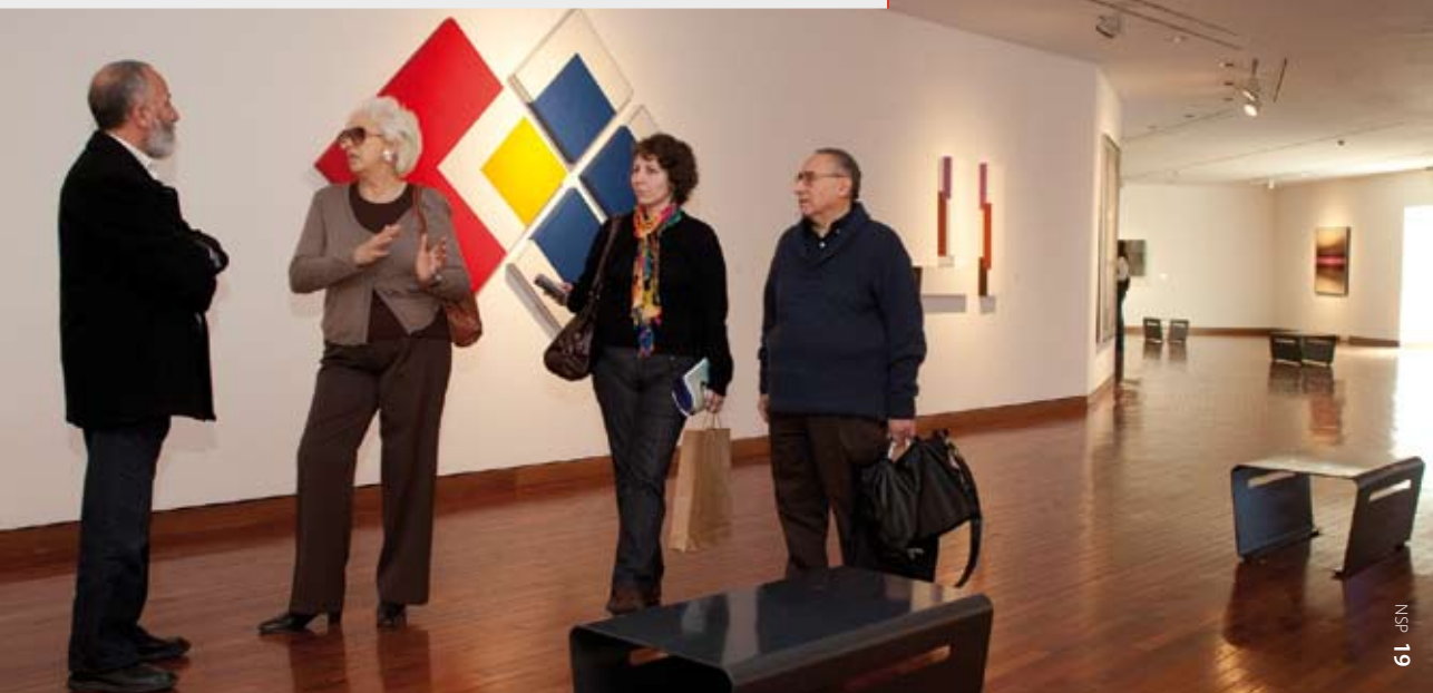
Admirando una de las nueve salas del Museo.