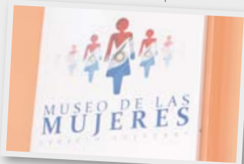
Museo de las Mujeres, un espacio único