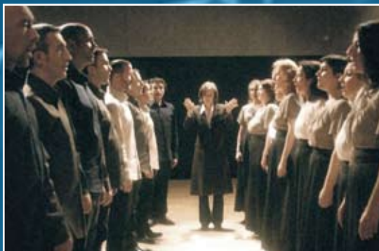
Equilbey con el Coro Accentus.