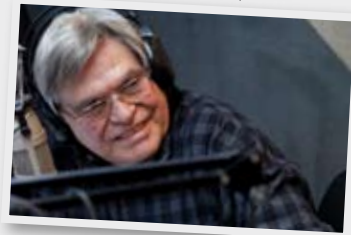
Misceláneas en la Docta