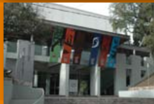
Museo Provincial de Ciencias Naturales Av. Poeta Lugones 395