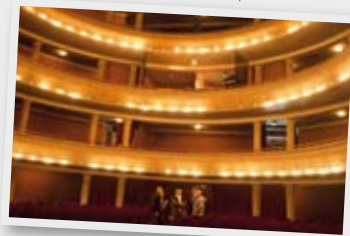
Estuvimos en el Teatro Real