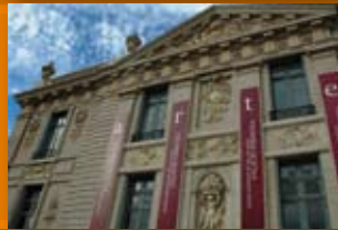
Museo Superior de Bellas Artes Evita H. Yrigoyen y Bv. Chacabuco