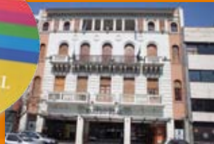
Teatro Real San Jerónimo 66