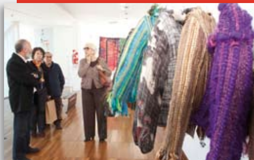
Espacio utilizado para exhibir arte aplicado a una colección de vestimenta con tejidos artesanales.