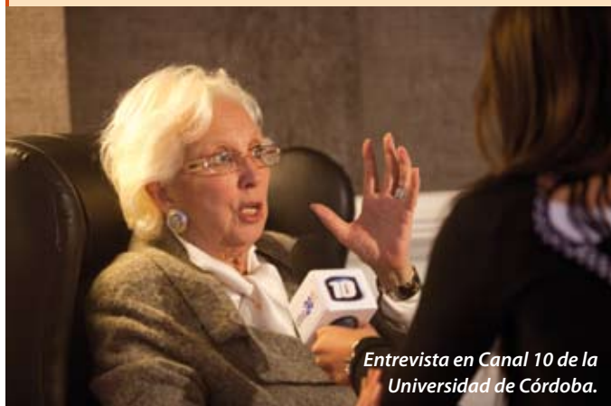
Entrevista en Canal 10 de la Universidad de Córdoba.