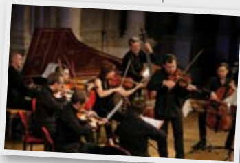
Mientras tanto, en Buenos Aires