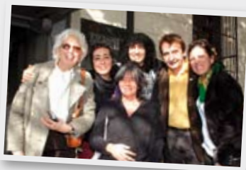
Reunión con asociados en la sede de AADI