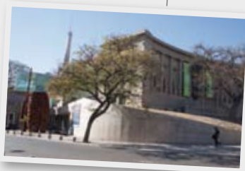
Visitamos el Museo Caraffa