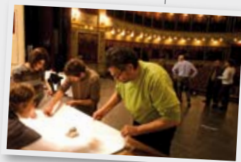
La vigencia del Teatro del Liberador San Martín