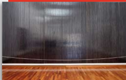
"Faith", obra de Gregor Hildebrandt, realizada con cintas de casetes.